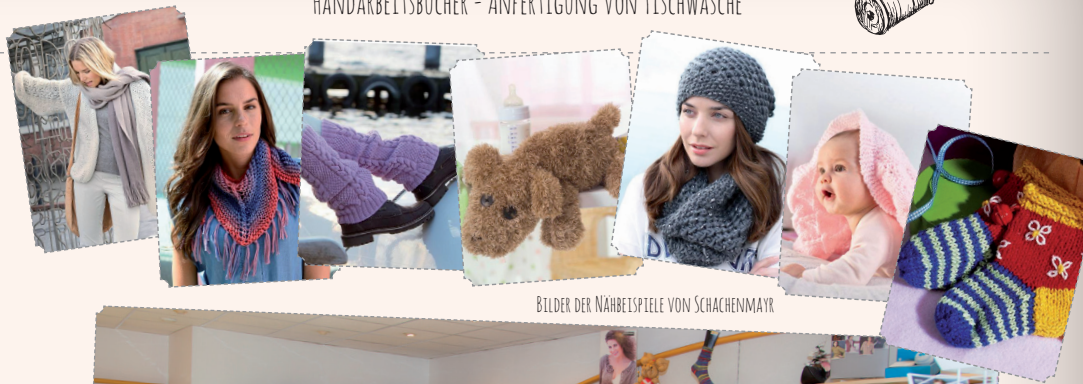
BILDER DER NAHREISPIELE VON SCHACHENMAYR